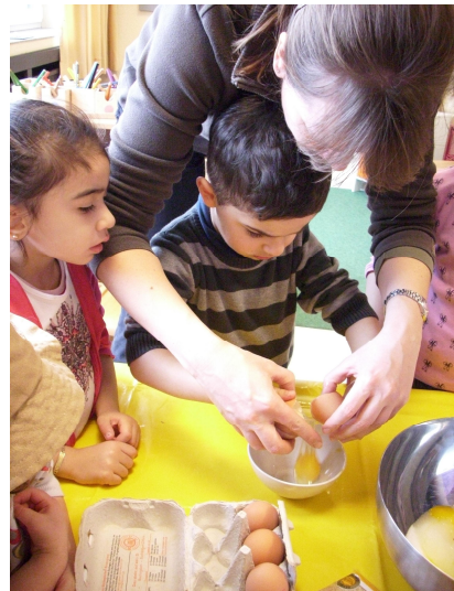
Gemeinsam klappt das Backen besonders gut.