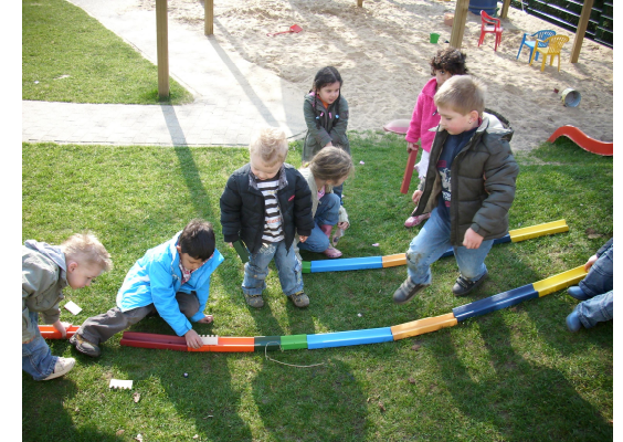
Die Murrelbahn können wir eigenständig mit unseren Freunden erkunden.