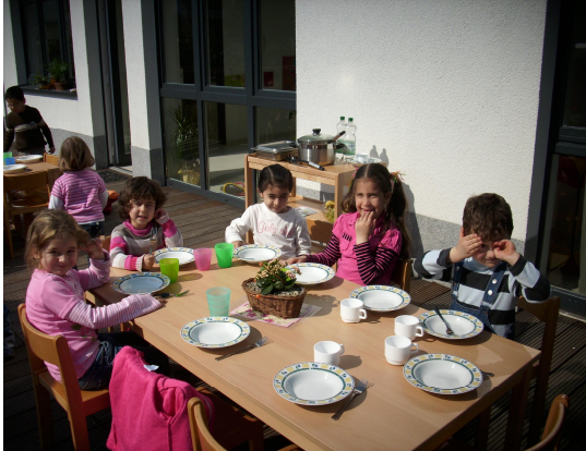
Bei schönem Wetter essen wir auf der Terrasse.